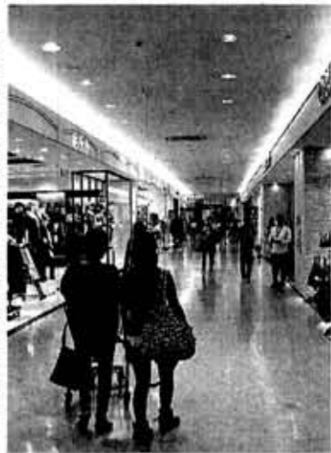
旗艦店でO.L向けに特化した区画などを設けた(那覇市のサンエー那覇メインプレイス)

スーパーのサンエーが5日発表した2012年3~8月期の連結決算は、純利益が前年同期比12%減の30億円となった。前年同期に退職給付制度を改定し、特別利益を計上しており反動減となった。売上高に相当する営業収益は新店の営業効果などで0.5%増の748億円だったが人件費や減価償却費の増加もあり営業利益は8%減。