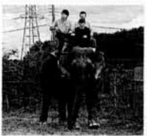
那須ワールドモンキーパーク

本社工場には現在、2つのラインがあり、第2ラインの生産設備を入れ替える。そのうえで工場内のラインの配置を変更し、第3ラインを新設する。両ラインとも主力商品であるペヤングソースやきそばと同超大盛を主に生産する。